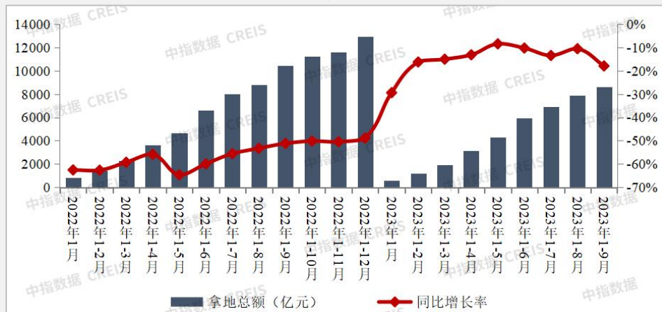
图：2022年至2023年1-9月TOP100房企拿地总额及同比增速情况

根据中指研究院《2023年1-9月全国房地产企业拿地TOP100排行榜》数据显示，2023年1-9月，TOP100企业拿地总额8599亿元，拿地规模同比下降17.9%，降幅较上月扩大7.4个百分点。分企业来看， 中海、建发、保利 等央国企拿地规模较高， 绿城、万科、龙湖、滨江 等混合所有制企业和民企亦有投资。