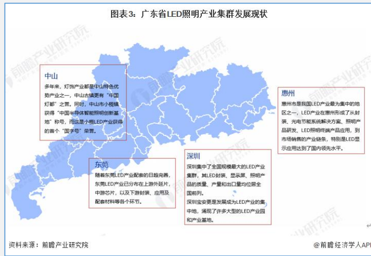
图表3：广东省LED照明产业集群发展现状