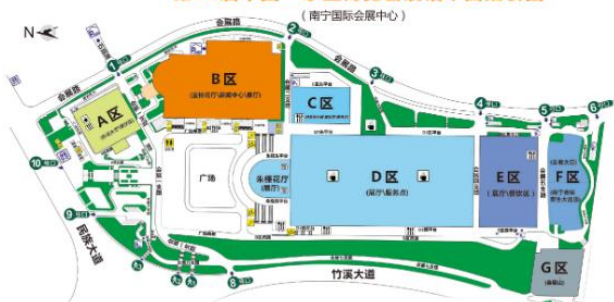
第20届中国—东盟博览会展馆平面指引图

第20届东博会将于9月16—19日举行，参展国家超过40个，参展的企业近1700家，其中外国展览面积占30%以上。其中，中国照明学会主办的2023年中国（南宁）国际照明展览会将在东盟博览会期间同时举行。