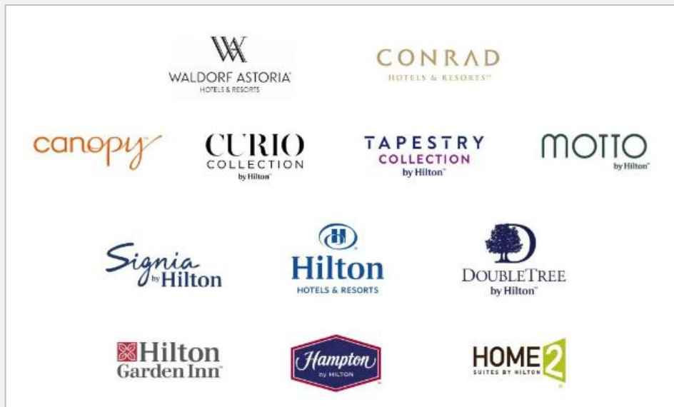
图：希尔顿集团在华酒店品牌矩阵扩充至12个